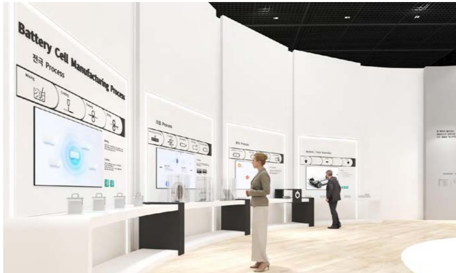
SK온의 Interbattery 2022 전시 부스

2022년에는 SK이노베이션 친환경 제품 및 서비스의 산식을 외부에 공개하여 이해관계자의 의견을 경청하고, VBA(Value Balancing Alliance) 및 하버드 경영대학원(Harvard Business School, HBS) 등 글로벌 파트너와의 협업을 통해 기존 제품 및 서비스에 대한 SV 측정 방법론을 고도화할 것입니다. 나아가 재활용 플라스틱 등 2021년 개발된 제품 및 서비스에 대한 측정 방법론 또한 개발하여 모든 성과를 투명하게 공개할 수 있도록 하겠습니다.