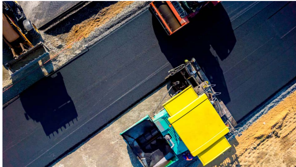
폐유 및 저장탱크의 슬러지를 활용한 아스팔트 제품 생산

SK이노베이션은 GROWTH 전략 핵심과제인 '사업장 폐기물 재활용'을 통해 폐기물 관리 시스템을 고도화하고 폐기물 관리 역량을 강화할 계획입니다. 본 핵심과제의 성공적인 수행을 통해 SK이노베이션의 사업으로 인한 환경오염을 최소화 할 뿐만 아니라, 사내 자원 활용의 극대화하여 이익을 창출할 수 있을 것이라 예상합니다.