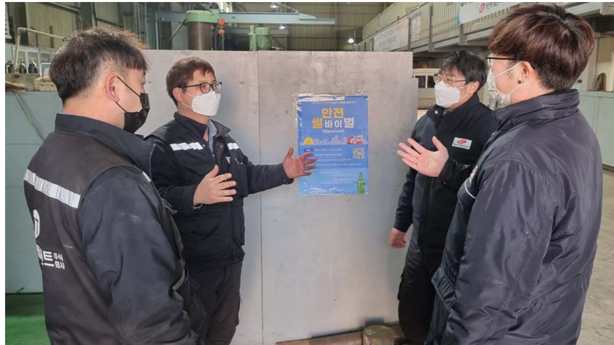
협력사 安心소통으로 안전사고 예방 강화

기업의 공급망에서 발생하는 환경 및 인권 문제에 대한 사회적 관심이 증가하고 세계 각국의 공급망 ESG 규제가 강화됨에 따라 기업의 책임있는 공급망 구축 및 관리 필요성이 증대되고 있습니다. SK이노베이션은 구매하는 제품과 서비스가 환경에 미치는 영향을 최소화하고 사회에 긍정적인 기여를 할 수 있도록 '지속 가능한 공급망 및 안정적 조달'을 '협력사 ESG 관리' 핵심과제의 궁극적인 목표로 설정하였습니다. 이러한 목표 달성을 위해 ESG 고위험 협력사를 정의하고 적극적인 관리 및 지원을 통해 발생 가능한 ESG 리스크를 사전에 최소화할 수 있도록 하며, 실질적인 개선 활동 실행을 지원하여 ESG 우수 협력사들을 지속적으로 육성하고자 합니다.